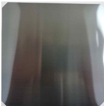
〈M2 크기 웨이퍼 사진 (예시)〉